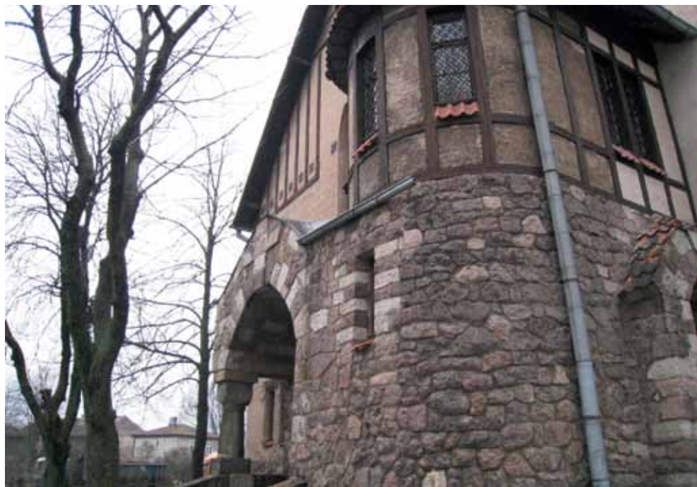
8. att. Krusta baznīcas fasādes fragments.