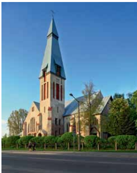
7.att. Krusta baznīca. Foto: Imants Prēdelis. Attēls no "Latvijas mākslas vēsture 1890–1915". 6. sēj. 532. lpp.

Krusta baznīca ir trīs jomu halles tipa dievnamš, tā plānojumam krusta formu piešķir transepts. Draudzes telpa segta ar krusta velvēm un dalīta deviņās travejās ar izteiktu vidusjoma dominanti. Tai piekļaujas poligona apsīda. Plānojumam asimetriju piešķir palīgtelpu un zvanu torņa izvietojums celtnes ziemeļu pusē. Arī kopējam apjomam ir plānojumam atbilstoša, asimetriska kompozīcija. Fasādēs izmantotais materiāls — akmens cokols un kontrforsī, kas izteiksmīgi kontrastē ar mūra apmestajām daļām un pildrežģi, rada monumentālu iespaidu, bet logailu kārtojumi uzsvēr celtnes apjoma vertikālo virzību. Atšķirībā no Dubultu baznīcas, pulkstenis,