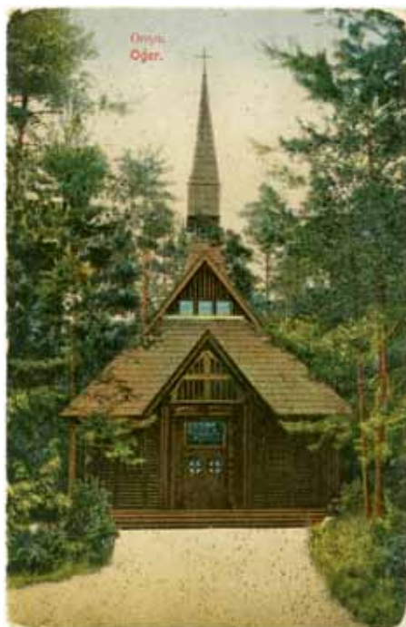
9. att. Ogres Meža kapela. 20. gs. sākuma pastkarte

baris draudzes vajadzībām. [...] Kā svinību gadījumā altāris un baznīcas priekšējā daļa izpušķotas greznām un košām mākslīgi audzētām puķēm, bet kancele greznota no dabīgo rudens puķu un augu bagātības: vijas un kroņi darināti no brūkleņu mētrām, viršiem, skujām un dažādām vēlīnām rudens krāsu puķēm. [...] Jaunais dievnams ir skaistā vietā, un arī pati būve ar savu ārpusi atstāj diezgan patīkamu iespaidu.” 62