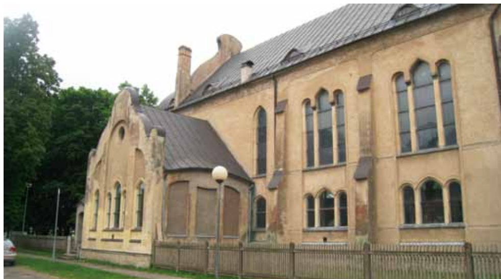
3. att. Dubultu baznīcas fasādes fragments.

2:1. Šaurākajā malā un rietumu pusē izvietotas luktas. Sakristejas un palīgtelpu kārtojums izriet no funkcionālās nepieciešamības, un asimetrija, kas atbilst ēkas plānojumam, organiski uzsverta arī dievnama eksterjera dinamiskajā apjomu kārtojumā. Celtnes galvenais vertikālais akcents ir augstais zvanu tornis rietumu fasādē, zem kura atrodas galvenā ieeja. Torņa masīvajai, četrstūra mūra daļai vieglumu piešķir dvīņu logi, aklās arkādes, pulkstenim paredzētie trijstūrveida segmenti torņa rietumu un austrumu pusē. Pildrežģa konstrukcijas līniju ritms torņa augšdaļā optiski mīkstina pāreju uz smaili, kuru noslēdz kupolveidīga konstrukcija ar vainagojošo krustu.