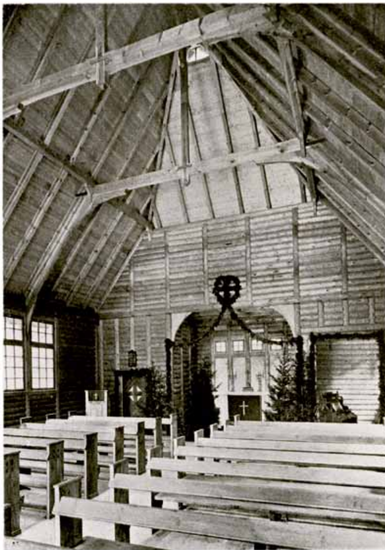
INNENANSICHT DER WALDKAPELLE IM OGERPARK.

10. att. Ogres Meža kapela. Attēls no "Jahrbuch für bildende Kunst in den Ostseeprovinzen". 1910. 4. S. 104.