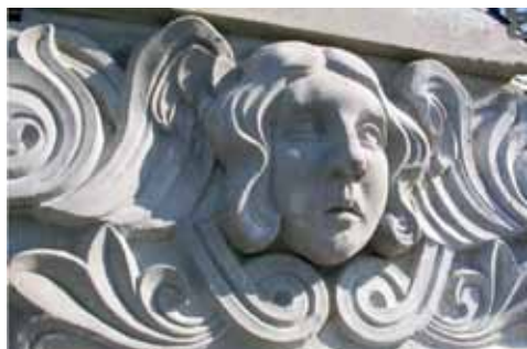
4. att. Eņģeļa maskarons Dubultu baznīcas tornī.

kas rotā prezbitērija un draudzes telpu nodalošo pacēlumu jumta daļā. Dievnama sānu fasādes vējtvera ieejas kolonas kapiteli redzamās četras ķerubū galviņas liecina, ka motīvu izvēli varēja rosināt arī Vecās Derības teksti, kas stāsta par Zālamana pirmo templi: “Un šīs divas durvis bija no olīvkoka, un viņš tanis izgreda ķerubus un palmas, un uzplaukušus ziedus. Un viņš tos pārklāja ar zeltu, arī ķerubiem un palmām viņš pārvilka zeltu.” (Ķēniņu gr. 6:32).