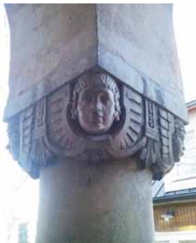
2. att. Dubultu baznīcas fasādes fragments.

piešķirts lūgšanu nama ( Bethaus ) statuss, bet 1864. g. nams apstiprināts par Slokas draudzes filiālbaznīcu. 1868. g. celtne tika pārbūvēta un paplašināta. Gadsimta beigās koka celtne ar 350 dievlūdēju vietām, draudzei palielinoties, bija kļuvusi par mazu, tomēr baznīcas tālāka paplašināšana vairs nebija iespējama.