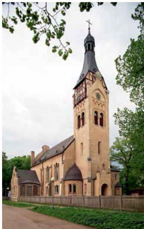
1. att. Dubultu baznīca. Foto: Imants Prēdelis. Attēls no "Latvijas mākslas vēsture 1890–1915". 6. sēj. 532. lpp.