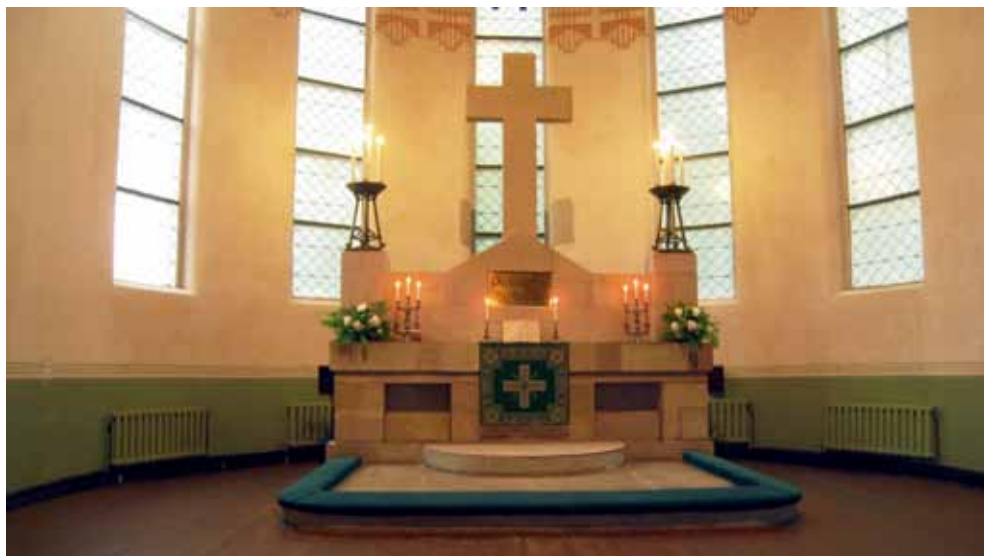
5. att. Dubultu baznīcas altāris.

Dievnama iekštelpu klāj līmenisks koka pārsegums, kura tumšais beicējums harmonē ar luktām un baznīcēnu soliēm, saskanīgs ir arī pārseguma siju un luktu stūraini ģeometrizēto segmentu ritms. Draudzes telpu no prezbitērija, kas noslēdzas ar pusaploces formas